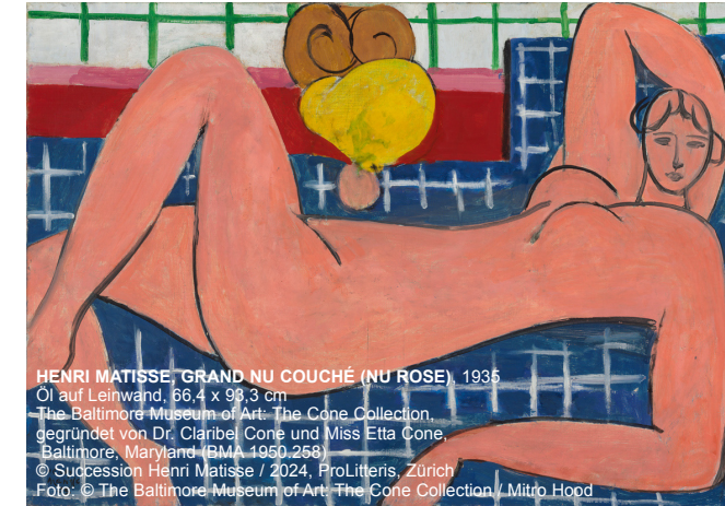
HENRI MATISSE, GRAND NU COUCHÉ (NU ROSE) 1935 Öl auf Leinwand, 66,4 x 99,3 cm The Baltimore Museum of Art, The Cone Collection, gegründet von Dr. Claribel Cone und Miss Etta Cone, Baltimore, Maryland, BMA-1959.258 © Succession Henri Matisse / 2024, ProLitteris, Zürich

Samstag, 23. November 2024 Abfahrt: 8.00 Uhr Bahnhof Gaggenau