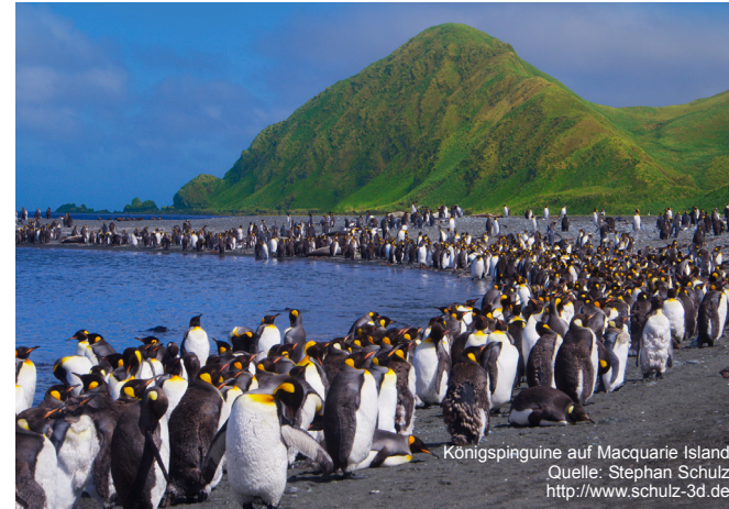
Königspinguine auf Macquarie Island

Donnerstag, 21. November 2024, 20.00 Uhr Bürgersaal des Rathauses Gaggenau