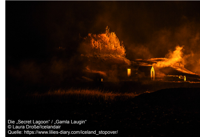
Die „Secret Lagoon“ / „Gamla Laugin“

Donnerstag, 19. September 2024, 20.00 Uhr Bürgersaal des Rathauses Gaggenau