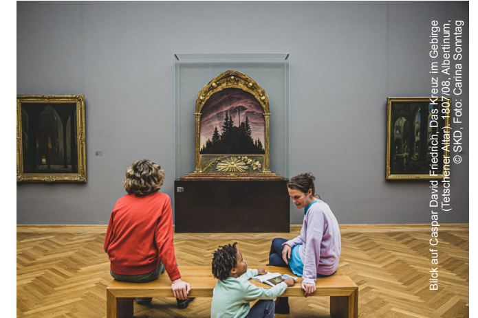
Blick auf Caspar David Friedrich, „Das Kreuz im Gebirge (Reischener Altar)“, 1807/08, Albertinum.

Samstag, 19. bis Montag, 21. Oktober 2024 Abfahrt Bahnhof Gaggenau