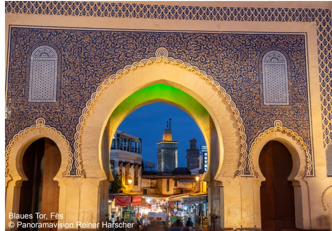
Blaues Tor, Fes

Mittwoch , 30. Oktober 2024, 20.00 Uhr Bürgersaal des Rathauses Gaggenau