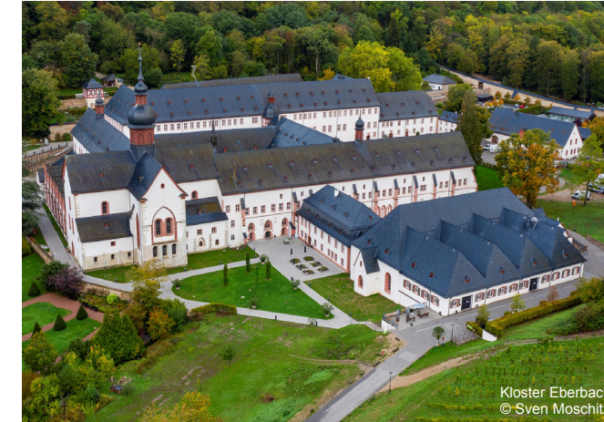
Kloster Eberbach

Samstag, 28. September 2024 Abfahrt 8.00 Uhr Bahnhof Gaggenau