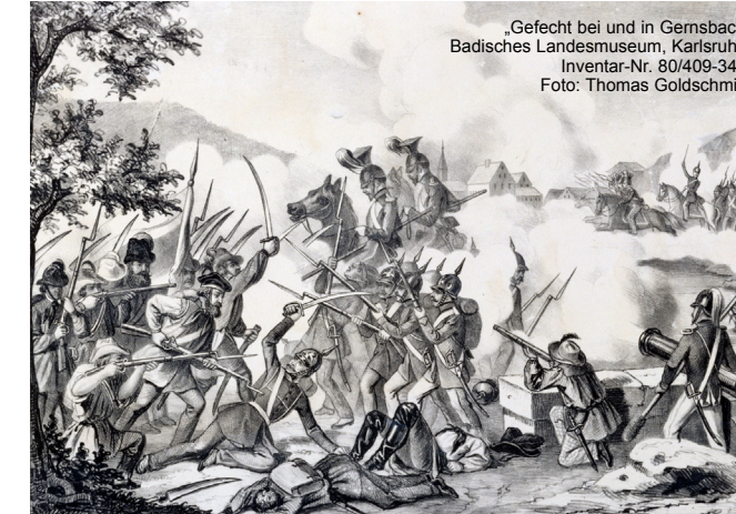
„Gefecht bei und in Gernsbach“ Badisches Landesmuseum, Karlsruhe. Inventar-Nr. 80/409-346.

Montag, 7. Oktober 2024, 20.00 Uhr Bürgersaal des Rathauses Gaggenau