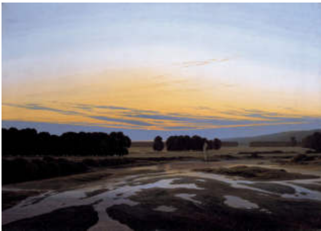
C.D. Friedrich: Das Große Gehege, etwa 1832