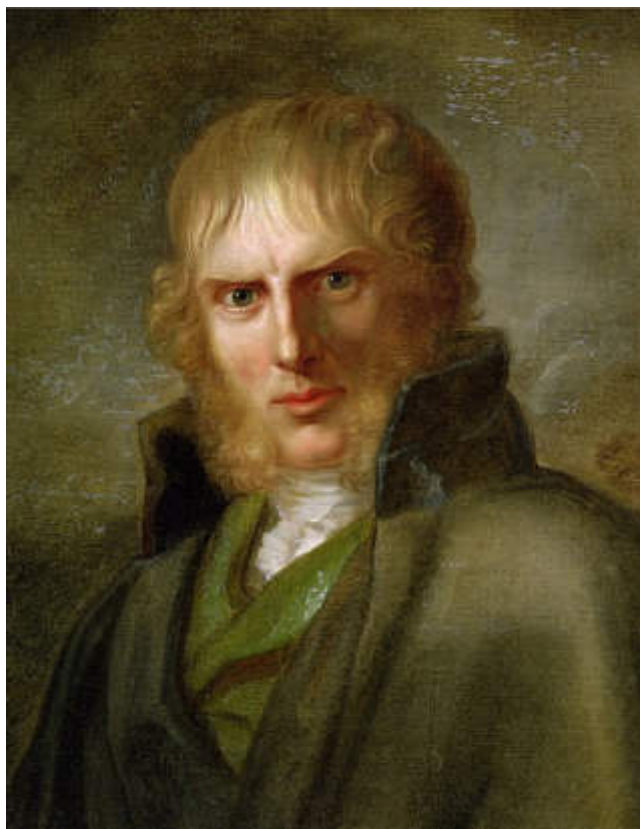
Gerhard von Kügelgen: Der Maler Caspar David Friedrich, Hamburger Kunsthalle

von Kügelgen, einem Freund Caspar David Friedrichs. Als Museum der Dresdner Romantik gibt es einen Eindruck von jener Ära in Dresden und stellt Leben und Werk der wichtigsten, damals hier wirkenden Künstlerpersönlichkeiten vor. Im Anschluss am späten Nachmittag Freizeit und individuelle Abendgestaltung.