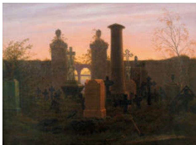
Grabstätte des Malers Gerhard von Kügelgen, Caspar David Friedrich